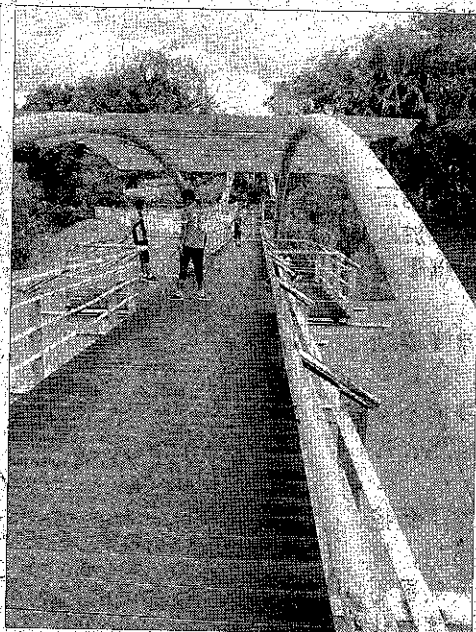
納閩植物園急待提升的各項休閒設備。