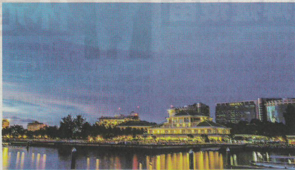
納閩 BILLION WATERFRONT 的繽紛燦爛夜景。