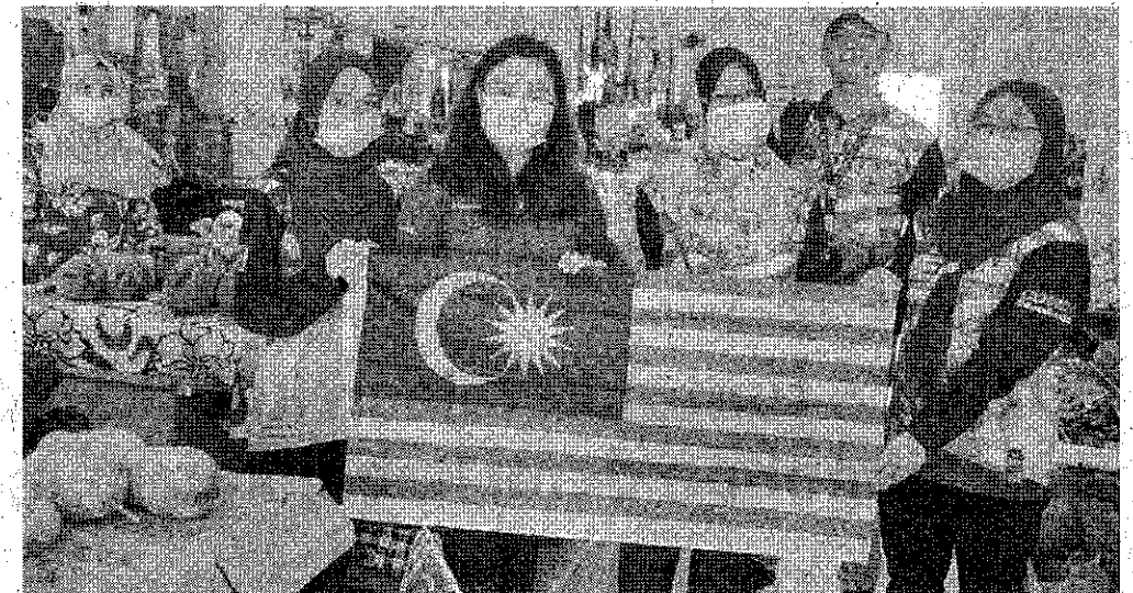
SEMARAK MERDEKA: Peniaga Pasar Sentral menerima Jalur Gemilang daripada peserta konvoi Semarak Merdeka.

“Antara pengisian lain adalah Info On Wheels Merdeka (IOW Merdeka), Merdeka@Komuniti, Pertandingan Pidato Kenegaraan, Sayembara Puisi Merdeka, Aspirasi