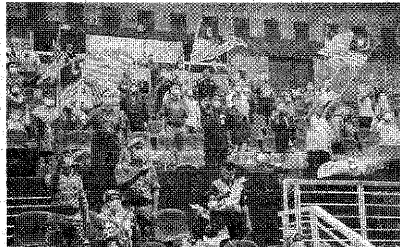
KIBAR MEGAH: Jalur Gemilang berkibar megah.