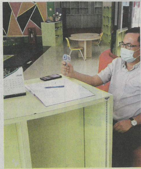
▲进入图书馆必须测量体温及登记