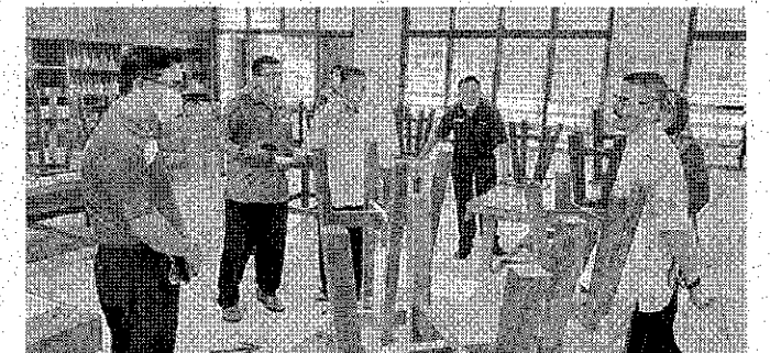
LAWATAN: Sesi lawatan ke Makmal Sains.