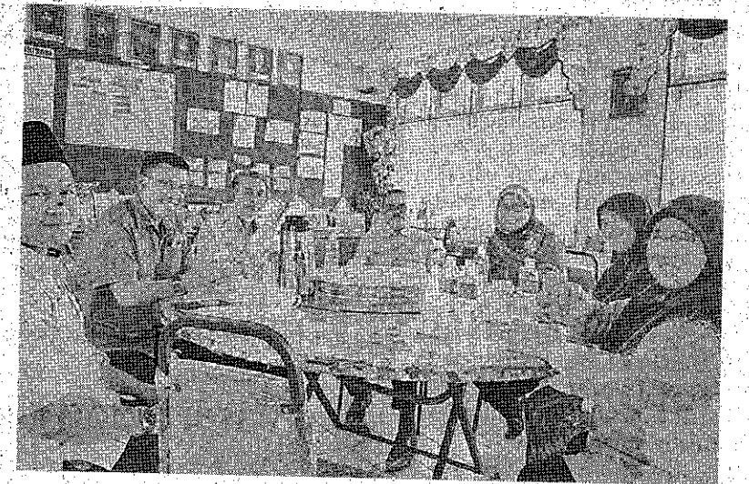
JAMUAN: Rombongan pelawat menikmati jamuan ringan setelah selesai sesi pemantauan.