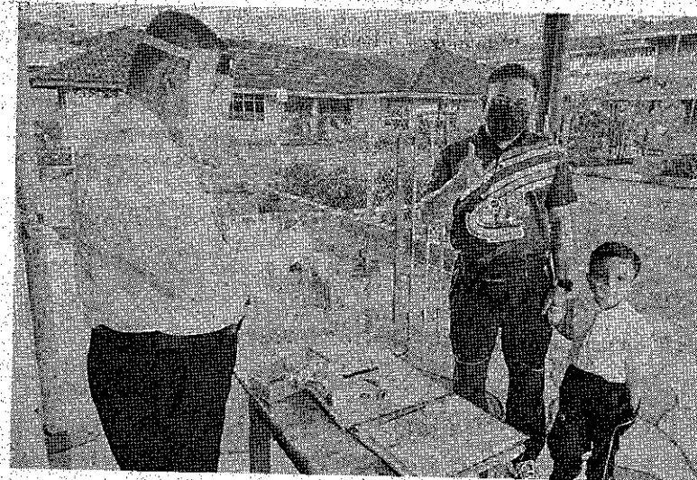
TERUJA: Hari pertama persekolahan prasekolah, murid teruja untuk be- lajar.