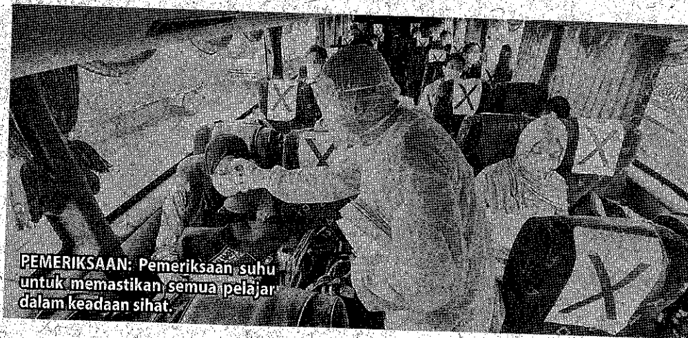
PEMERIKSAAN: Pemeriksaan suhu untuk memastikan semua pelajar dalam keadaan sihat.