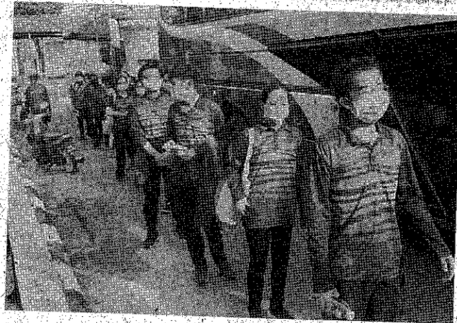
BERBARIS: Pelajar berbaris untuk menaiki bas ke Terminal Feri Labuan.

Penghantaran pulang pelajar-pelajar yang terkandas untuk pulang ke rumah masing-masing adalah daripada usaha pihak pengurusan Kolej Matrikulasi Labuan, Jawatankuasa Pengurusan Bencana Labuan, Kement-