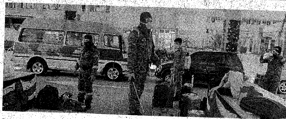
DISINFEKSI: Proses disinfeksi beg dan barang milik pelajar oleh Jabatan Bomba dan Penyelamat Labuan.