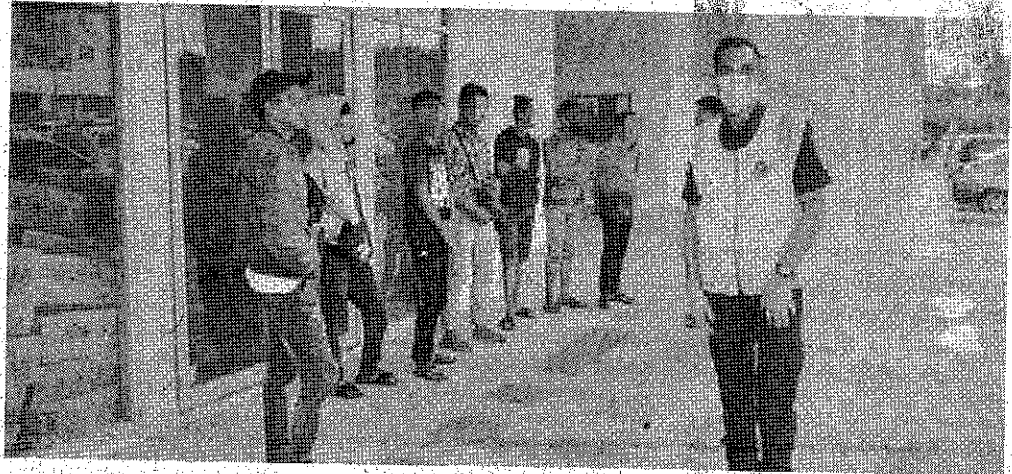
TERIMA PADAH: Sekumpulan remaja ditahan mengabaikan penjarakan sosial.

Menurut Farid, semua remaja berkenaan dibawa ke Balai Polis Labuan untuk tindakan kompaun dibawah Peraturan 7(1) Peraturan-