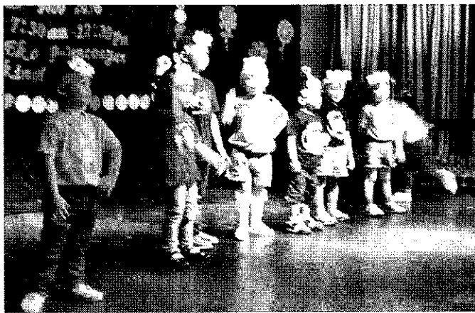
PERSEMBAHAN ‘Monkey Dance’.