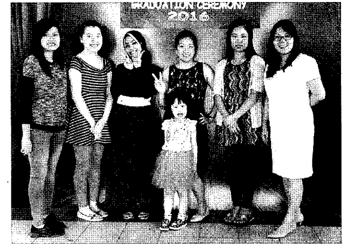
GURU Tadika Minda Labuan yang terlibat.

penyampaian hadiah dan juga sijil kepada murid yang berkecuali.