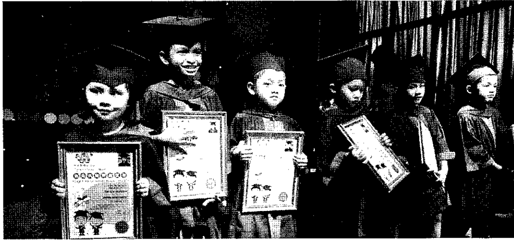
PELAJAR yang tamat pembelajaran tadika.

Mungkin sesetengah ibu bapa menganggap bahawa permainan akan menjadi satu pembaziran masa dan ia boleh melambatkan pembelajaran murid-murid, tetapi ia adalah satu prasangka yang salah.