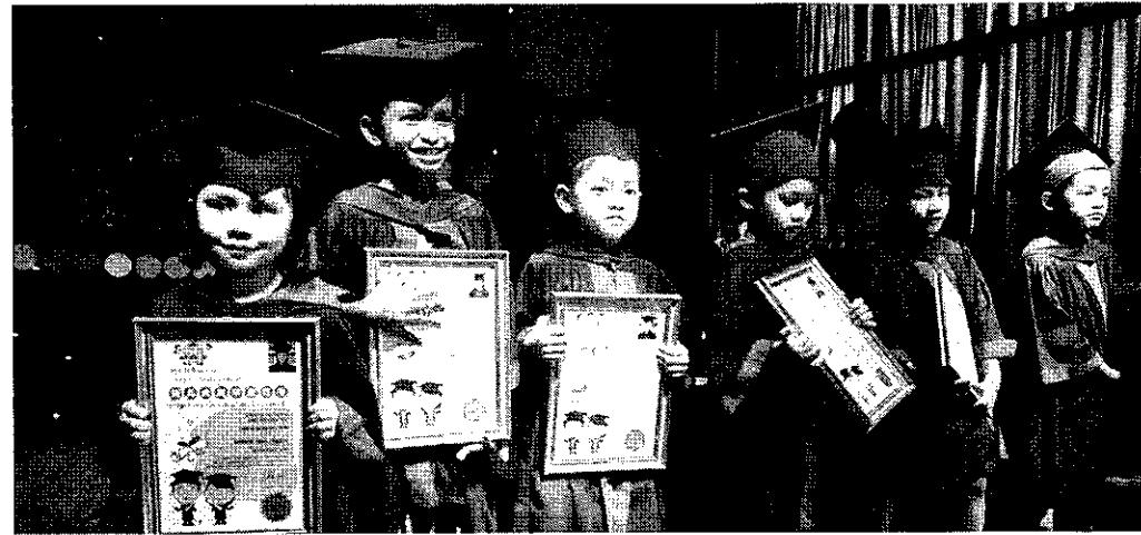
PELAJAR yang tamat pembelajaran tadika.

“Untuk maklumat ibu bapa, permainan adalah salah satu jenis penyertaan murid-murid dalam aktiviti.