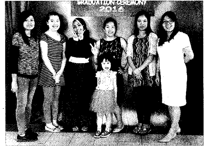
GURU Tadika Minda Labuan yang terlibat.

penyampaian hadiah dan juga sijil kepada murid yang berkenaan.