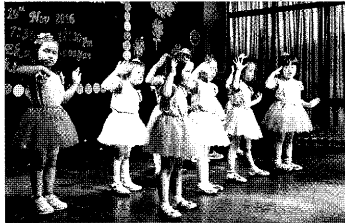
PERSEMBAHAN Barbie Girl.