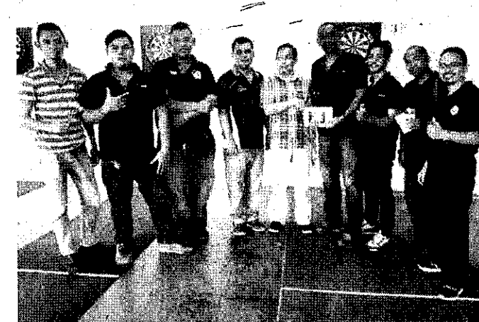
PASUKAN Kampung Sungai Bedaun 1 (tempat ketiga bersama).

Muhd Tahir mengucapkan terima kasih kepada pasukan yang menyertai pertandingan itu sekaligus memberikan pemain ruang serta peluang mengasah bakat dan membuktikan kehebatan masing-masing.