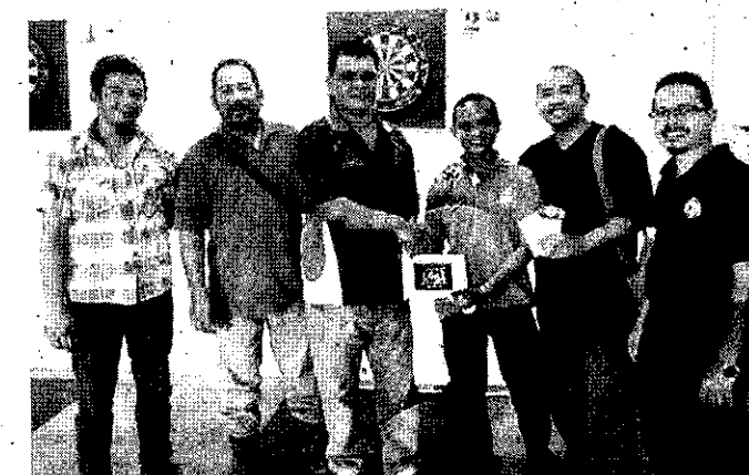
PASUKAN Sungai Lada (tempat ketiga bersama).